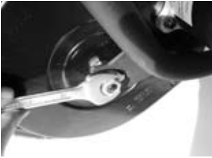
1. Schraube an Achse weit lösen.