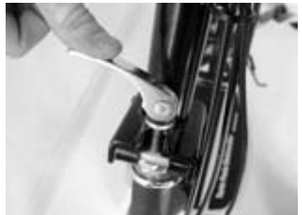
6. Sicherungsschnalle spannen.