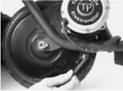
6. Schraube an Motorplatte vorne lösen.