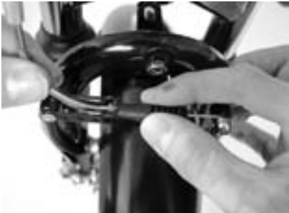
1. Ziehen Sie den Gummischutz . . .