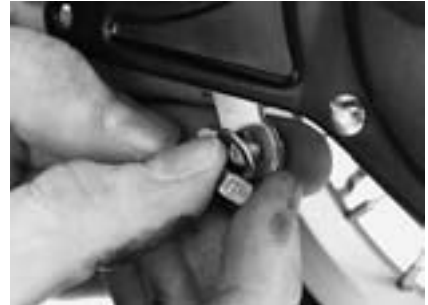
9. Schrauben lösen.