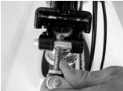
1. Lenker aufrichten.

Zum sicheren Fahren mit Tante Paula muss der Lenker unbedingt richtig arretiert werden. Dazu folgen Sie bitte aufmerksam folgender Anweisung.