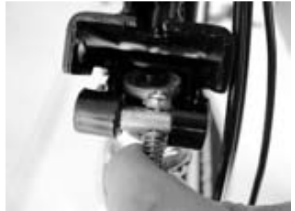
2. Bolzen seitlich verschieben, so dass der Lenker komplett aufgerichtet werden kann . . .