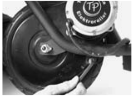
2. Schraube an Motorblech lösen.