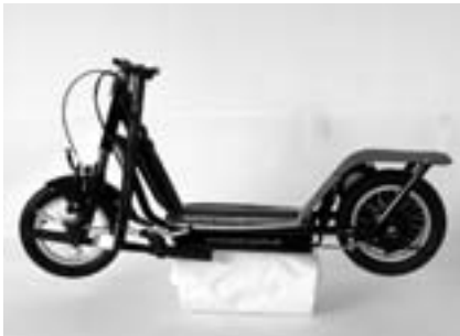
1 vormontierter Elektroroller

Das Ihnen zugestellte Paket beinhaltet folgende Teile: