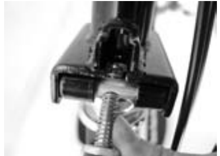
4. Bolzen in andere Richtung verschieben (Scharnier sichern)