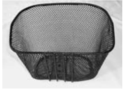
1 Körbchen inkl. Befestigungs- schrauben, Unterlegscheiben