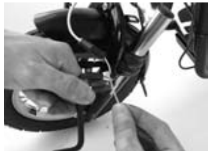
6. Sie können jetzt die Imbusschraube am linken Bremsarm lösen, den Bowdenzug ein wenig weiter spannen und danach die Schraube festziehen. Spannen Sie den Bowdenzug in kleinen Schritten (1 cm ist schon viel!!).