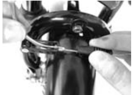
2. . . . an der Vorderbremse zur Seite.