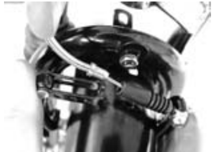
4. Jetzt können Sie das kleine gebogene Metallröhrchen, durch das der Bowdenzug läuft, aus der rechten Bremsseite heben.