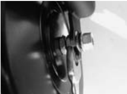
3. Äußere Kontermutter lösen.