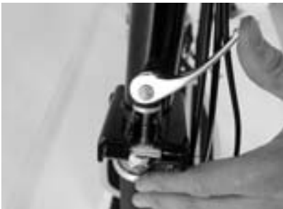
5. Sicherungsschraube mit Feder in dafür vorgesehene Nut drehen.