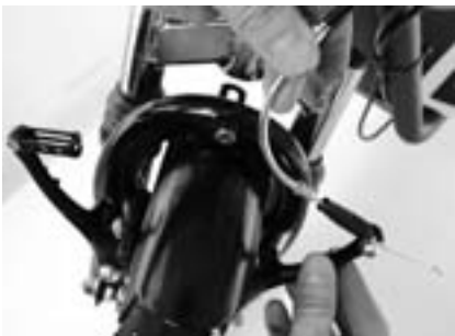
5. Die Bremse steht jetzt nicht mehr unter Spannung.