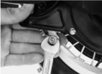
8. Bowdenzug von Bremse lösen. (Siehe auch Bremsen einstellen)