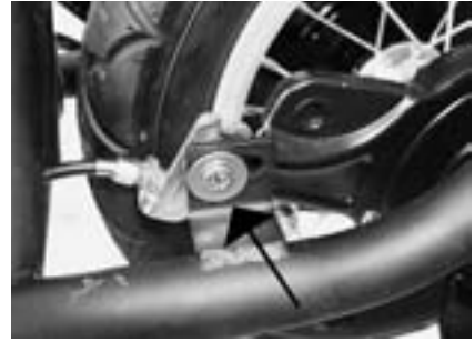
7. Hinterbremse von Rahmen lösen.