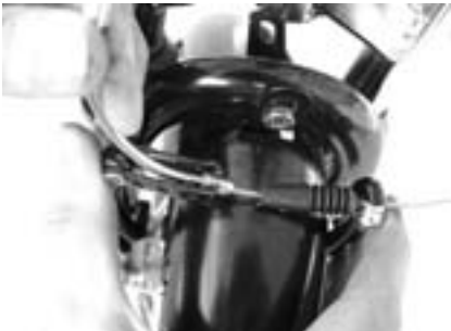
3. Drücken Sie beide Bremshebel zusammen, sodass die Bremse greift und sich der Bowdenzug lockert.