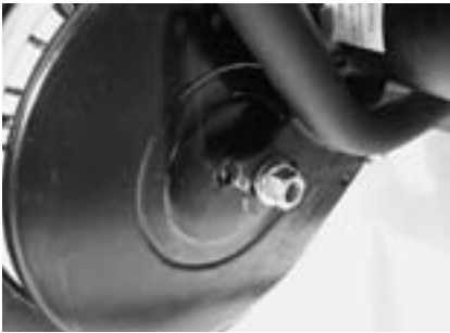
5. Motorblech der Kettenspannung . . .