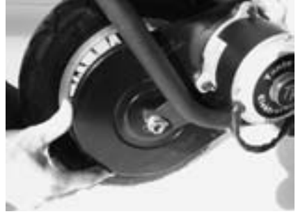
6. . . . entsprechend verschieben.

7. Es reicht, die Kette leicht zu spannen, Sie soll nicht »knallhart« gespannt sein, sondern noch etwas Spiel haben.