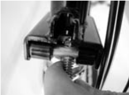
3. . . . und das Scharnier somit schließt.