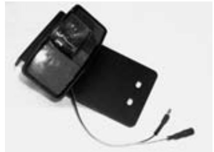
Nummernschildhalter mit vormontierter Rückleuchte und Kabel