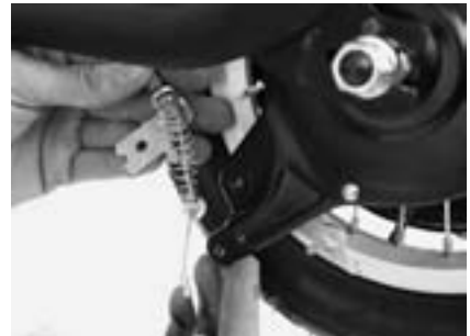
11. Hinterradbremse lösen